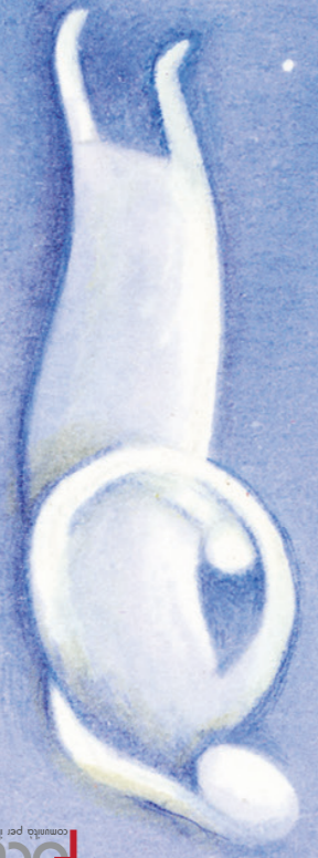
Illustrazione tratta da Tiritere di Bruno Tognolini e Antonella Abbaticchio ©2008 Franco Cosimo Panini Editore Progetto grafico F. Ascarti Comune di Carpi

Nel corso dell'anno verranno organizzati incontri a tema.