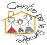
Centro per le famiglie di Faenza