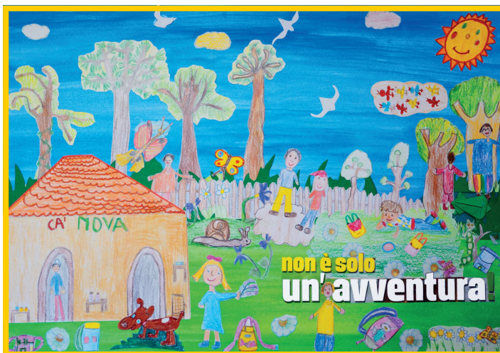
Disegno selezionato dal Concorso “Disegno l'Ambiente - Anno scolastico 2012-2013” Scuola Tavelli - Scuola Primaria, Ravenna - Classe IA

L'Assessorato e il Servizio Ambiente del Comune di Ravenna, intendono mantenere e confermare il proprio impegno per la realizzazione di questa attività di educazione ambientale che si fonda sull'idea della “pineta e natura come laboratorio scolastico all'aperto” . Il progetto coinvolge attivamente le bambine ed i bambini delle scuole ravennati e l'intera comunità in una relazione stabile con il proprio territorio cercando di favorire lo sviluppo di maggiori conoscenze e sensibilità verso i concetti e la filosofia di “sviluppo sostenibile” , “conservazione della biodiversità” .