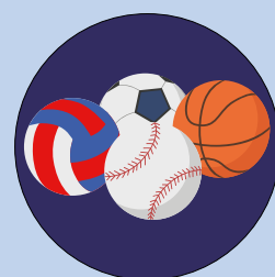
Multisport: • parkour • basket • softball • ginnastica • piscina con esperti

Iscrizioni aperte per bambini dai 24 ai 36 mesi Solo per il mese di agosto, massimo 10 iscritti