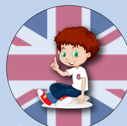
Potenziamento di inglese una volta alla settimana