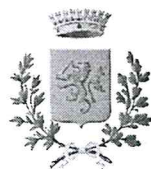
COMUNE DI FORLÌMPOPOLI