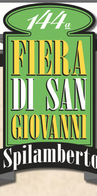
Foto: Massimo Trenti, Christian Cornia, Archivio Comunale Luigi Ottani (foto Sindaco)