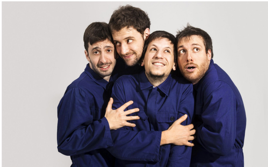
EUGENIO IN VIA DI GIOIA